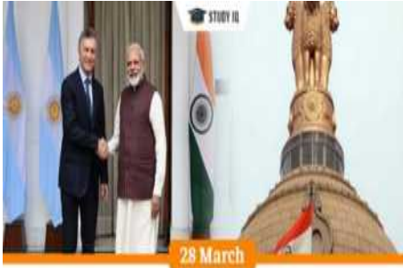
CABINET APPROVES MOU BETWEEN INDIA AND ARGENTINA ON ANTARCTIC COOPERATION