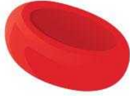
Normal Red Blood Cell